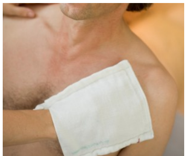
Eiskalter Schreck in der Morgenstunde