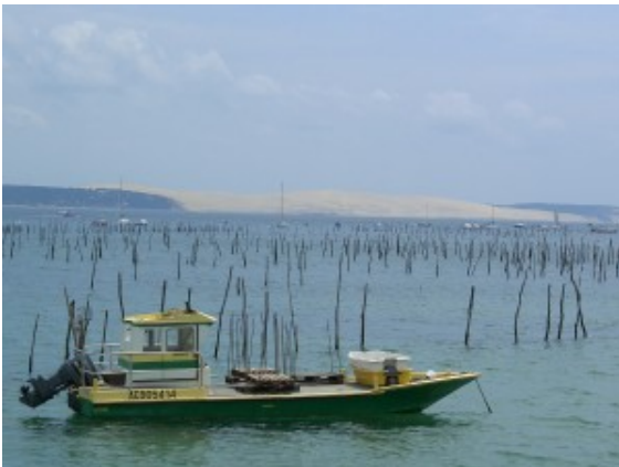
Austernbänke im Becken von Arcachon

Kein Besuch der französischen Atlantikküste sollte ohne einen Abstecher zur Bucht von Arcachon enden. Allein schon, um die spektakuläre Düne von Pilat zu bewundern, die den Atlantik von der Bucht trennt. Durch eine Enge von dreieinhalb Kilometern fließt frisches Meereswasser in das Becken.